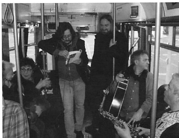
Litera TOUR – Lesung in der Straßenbahn!

Nichts schützt den Mensch vor der Dummheit, Vorurteil, Rassismus, religiösem oder politischem